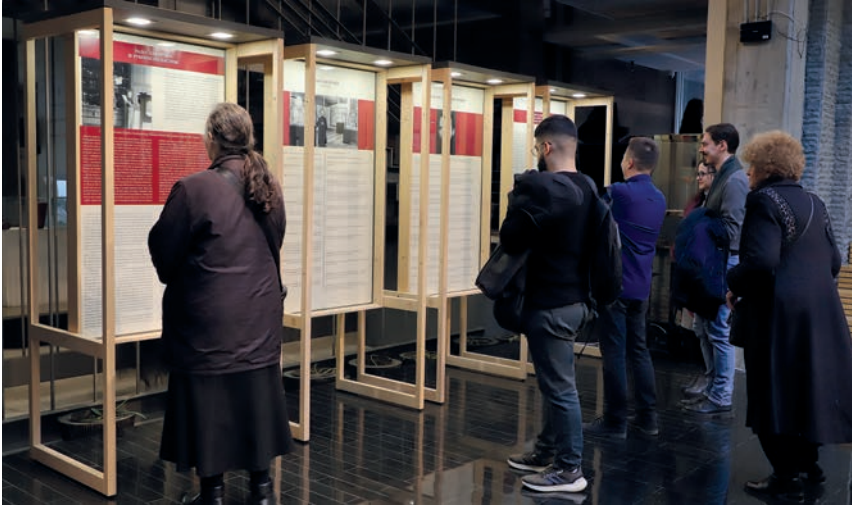
Сл. 9. Детаљ са пратеће изложбе

археографије код нас померају и за неколико деценија раније. Наиме, захваљујући раду Љубомира Стојановића и Радослава Грујића можемо рећи да је интензиван развој археографије као науке код нас отпочео већ у раном 20. веку.