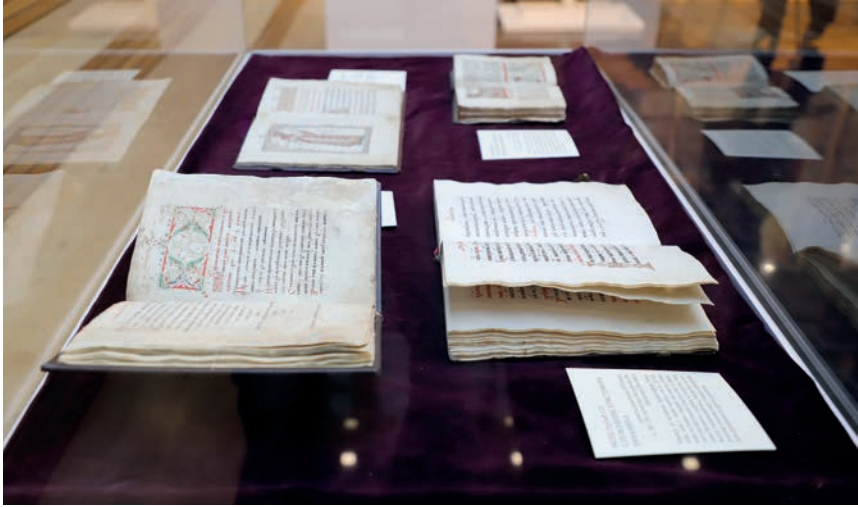
Сл. 8. Детаљ са пратеће изложбе