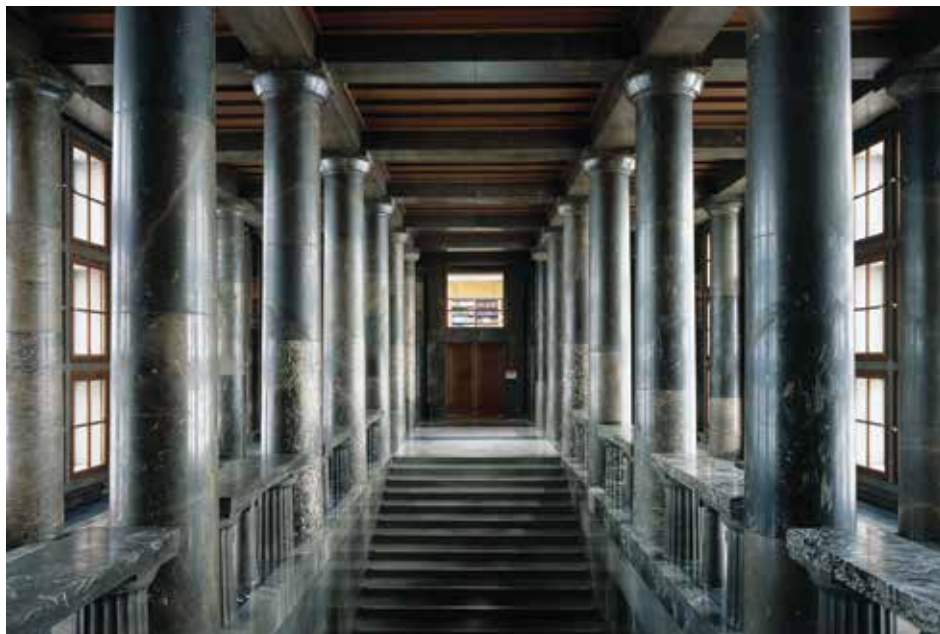
НУК – Улазно степенште са стубовима