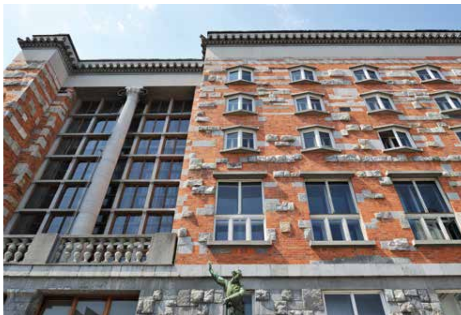
НУК – фасада