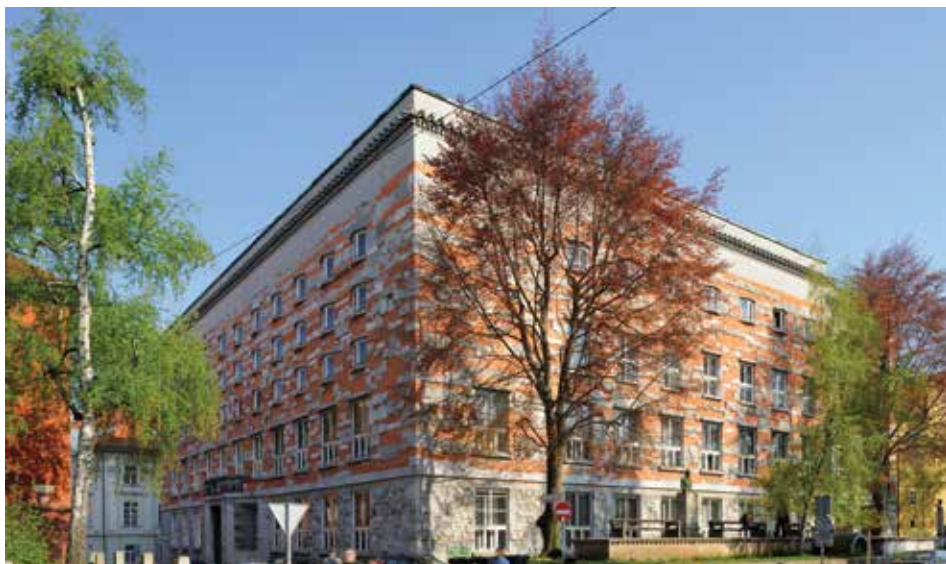
НУК

Ове, 2021, у Паризу ће се одлучивати о упису нових дела са подручја архитектуре на списак Унескове културне баштине. Номиновано је осам реализација америчког архитекте Френка Лојда Рајта, као и седамнаест дела швајцарско-француског архитекте Ле Корбизјеа. Словенија је том списку додала и свој предлог од осам урбанистичко-архитектонских реализација Јожета Плечника, а међу њима је и зграда Народне и универзитетске библиотеке.