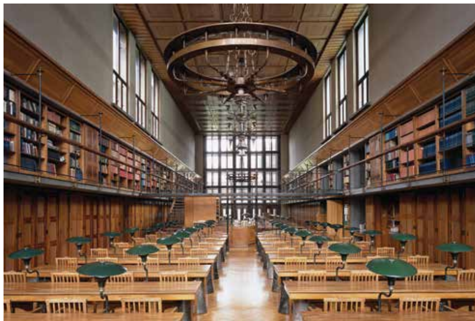
НУК – читаоница