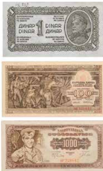
Новчаница од једног динара ДФЈ из 1944. године; новчаница од 100 динара ФНРЈ из 1953. године; новчаница од 1000 динара СФРЈ из 1963. године.

Колекција садржи скоро комплетне серије новца квислиншких државних режима – Недићеве Србије 10 , Независне државе Хрватске 11 и Рупника у Словенији 12 . До сада, поменути серијама новчаница припадају и оне које су издаване и коришћене од стране следећих држава – Демократске Федеративне Југославије 13 , Федеративне Народне Републике Југославије и Социјалистичке Федеративне Републике Југославије 14 .