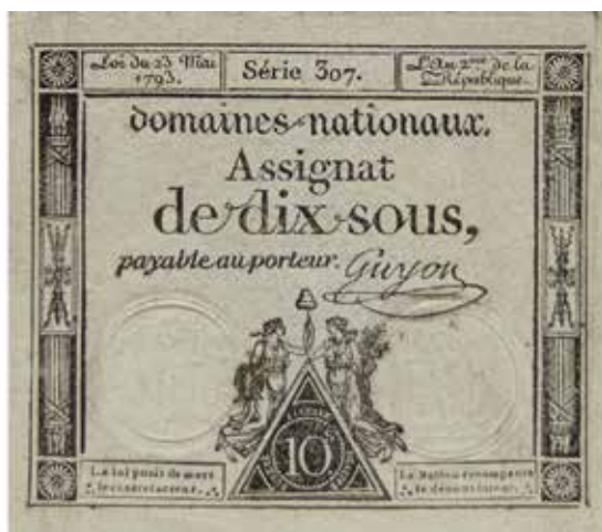
Француски асигнат из 1793. године

Велико богатство фонда чини збирка страног новца: Пољске 16 , Чехословачке 17 , Мађарске 18 , Аустрије 19 , Немачке 20 , Француске 21 , Русије 22 , Бугарске 23 , Грчке 24 , Италије 25 , Румуније 26 , Албаније, Норвешке, Белгије, Велике Британије, Данске, Шпаније и Холандије, Турске и Кине 27 . Према значају се издвајају: француски и пољски асигнати из 18. века, новац цивилних и војних логора из Првог и Другог светског рата 28 и помоћни новац аустријских 29 и немачких градова 30 .