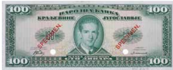
Новчаница од 100 динара Краљевине Југославије из 1943. године

Ретка је серија новчаница Краљевине Југославије – специмена штампаних у Лондону 1943. године с ликом краља Петра II на аверсу и географским мотивима на реверсу, које никад нису пуштене у оптицај.