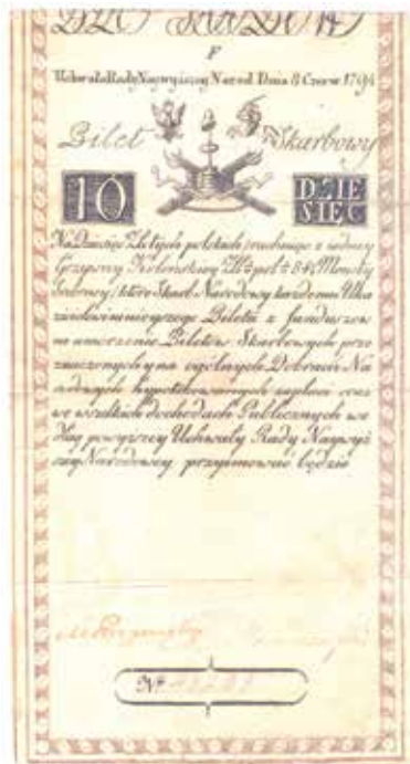
Пољски асигнат из 1794. године