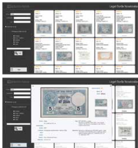
Изглед мултимедијалне презентације на десктоп рачунару

Мултимедијална презентација је својеврстан каталог новчаница из легата. Презентација се састоји из више нивоа који омогућавају брзу и једноставну претрагу података кроз задате критеријуме. Презентација се налази на USB флеш меморијама, које су заштићене од измене и копирања података.