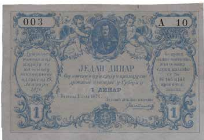
Новчаница од једног динара Кнежевине Србије из 1876. године

Папирне новчанице у Легату издаване су од половине 19. до прве половине 20. века. Најзначајнији део фонда чине националне новчанице почев од прве серије, никад пуштене у оптицај, из 1876, 7 преко новчаница Краљевства и Краљевине Срба, Хрвата и Словенаца 8 , Србије и Југославије. У овој групи налази се општински новац разних градова – Београда, Новог Сада, Сарајева, Загреба и Љубљане. 9